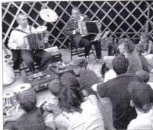
SCÈNE. Des comédiens qui savent jouer et conter.

La troupe « Batahola de la pintura » a joué à guichets fermés, samedi dernier, au cours de la onzième édition de la Fête des paniers.