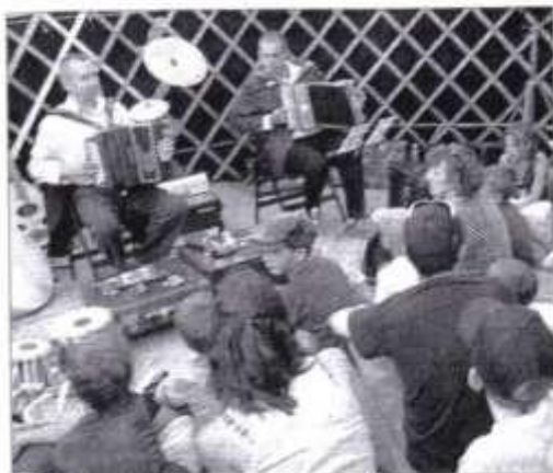
SCÈNE. Des comédiens qui savent jouer et conter.

La troupe « Batahola de la pintura » a joué à guichets fermés, samedi dernier, au cours de la onzième édition de la Fête des paniers.