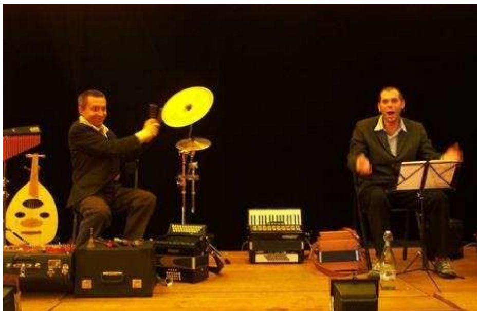
PHOTO DU SPECTACLE

Durée : entre 40 minutes et 1 heure. Tout public dès 7 ans.