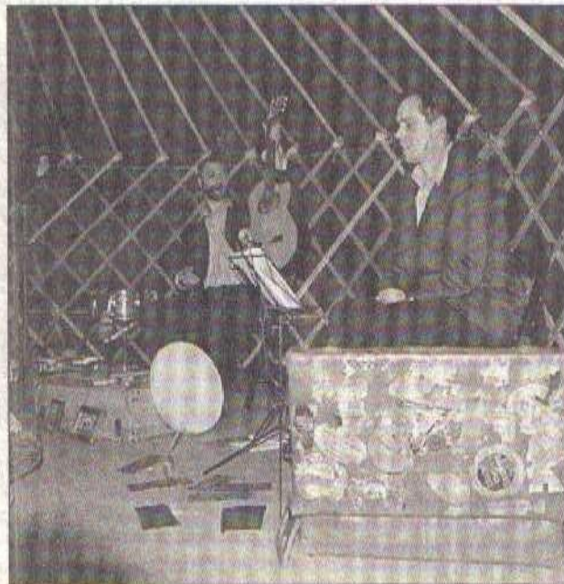
Une valise pleine de contes et légendes d'Auvergne

public de tous âges et les acteurs, tour à tour lecteurs, conteurs et musiciens. Des légendes auvergnates, bien surannées, sorties d'une valise en carton après un tirage de cartes par des spectateurs beaujolais assis sous