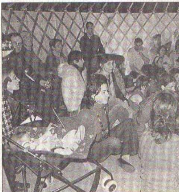
Première séance : la yourte est pleine

E T NON pas contes au coin du feu, mais on s'y serait cru, tant l'intimité créée par la yourte et l'éclairage chaud a évoqué les longues veillées... d'avant l'électricité. Cependant, le courant est très bien passé entre le