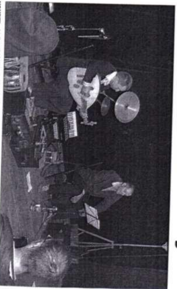
YOURTE. La Batahola invite à un voyage en contes.

Spectacle intime sous la yourte. Il est aussi spectacle pour tous, à partir de 5 ans. ■